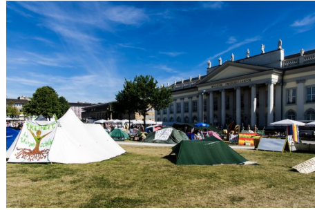
Occupy podczas 13. Edycji Documenta w Kassel, 18.08.2012

Najbardziej interesujący jest poruszany przez obu autorów