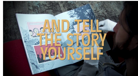
Performatywne czytanie The Migrant