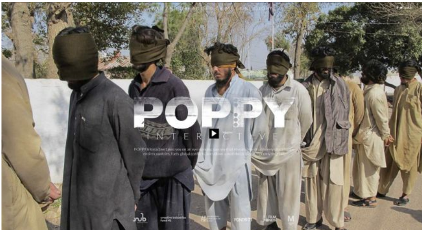
Strona główna Poppy Interactive

nakładając się na siebie. Tu można doświadczyć pewnego nadmiaru, związanego z radością odkrywania nowego medium, jakby twórcy utworu dobrze bawili się elementami interfejsu i interakcji, co czasem odwraca uwagę od narracji wizualnej. Pod wieloma względami jest to jednak doświadczenie doskonale realizujące przedstawione tu postulaty.