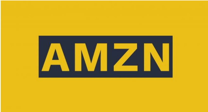
Cyfrowe wcielenie AMZN Tytusa Szabelskiego. Więcej o projekcie na stronie domowej artysty

AMZN Tytusa Szabelskiego to interaktywne archiwum wytworzonych lub też zebranych przez twórcę materiałów, które mają pomóc naświetlić sposoby, w jakie Amazon, największy globalny dostawca detaliczny, zmienia rozumienie, rytm i strukturę pracy w współczesnym świecie. Celem doświadczenia cyfrowego AMZN było od samego początku poruszenie osób odbiorczych – do myślenia, do działania, do wykorzystania materiałów zebranych w tym cyfrowym magazynie do własnych celów, inicjatyw, rozmów, akcji. Właśnie dlatego każda osoba po zakończeniu sesji może ściągnąć wszystkie obejrzone i przeczytane materiały na własny komputer. W tym sensie AMZN stanowi zasób, uzupełnienie wystawienniczej wersji projektu 76 , pozwalający osobom uczestniczącym w wystawie „uruchomić” znajdujące się tam obrazy i obiekty, zamienić je w impet – polityczny, twórczy. Po ukończeniu projektu postanowiliśmy sami sprawdzić w działaniu możliwości, jakie daje AMZN.vnLab.org .