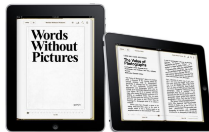
Od bloga poprzez drukowaną książkę z powrotem do postaci drukowanej: Words Without Pictures jako e-book