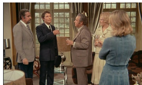
Eksperyment – Dyskretny urok burżuazji (1972)

Istotą tej sceny nie jest ani klasistowskie ostrze, ani nawet ironia pełnego obłudy, „progresywnego” włączenia szofera poprzez odwrócenie jego toastu – ale przewidywalność, z jaką rozgrywa się interakcyjny rytuał. Jego moc i nieuchronność są znamiem symbolicznego – działania stabilnej matrycy, która kieruje nawet najbardziej „spontanicznymi” zachowaniami. Szofer, wypijając drinka w sposób niewłaściwy, „spełnił swoją powinność” – potwierdził obowiązywanie społecznego imperatywu.