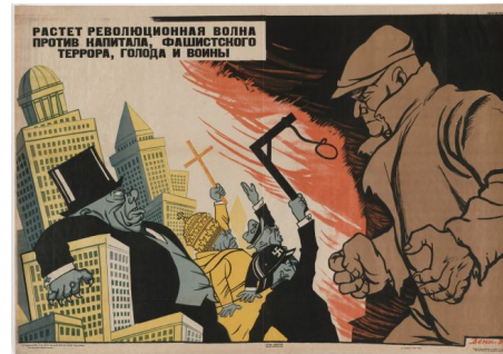
Victor Deni, litografia, ok. 1941

W reprezentacjach wyrażających lęk przed rewolucyjnymi klasami ujawnia się inna dynamika, dokładnie prześlędzona przez