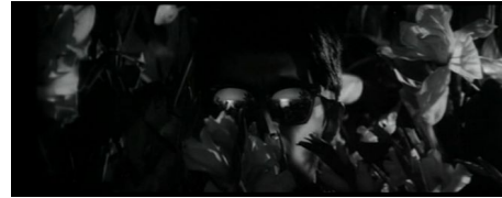
Resentyment: ciemne okulary odbijające „spojrzenie” otoczenia – Niebo i piekło (1963)

W Parasite napięcie to podlega charakterystycznej refeudalizacji 67 – różnica klasowa nie ma rozpoznawalnych konturów, jest przepaścią między dwoma „stanami” (mieszczactwa i podklasy), których życie różni się w sposób radykalny, pozbawiony wzajemnych odniesień i politycznego znaczenia.