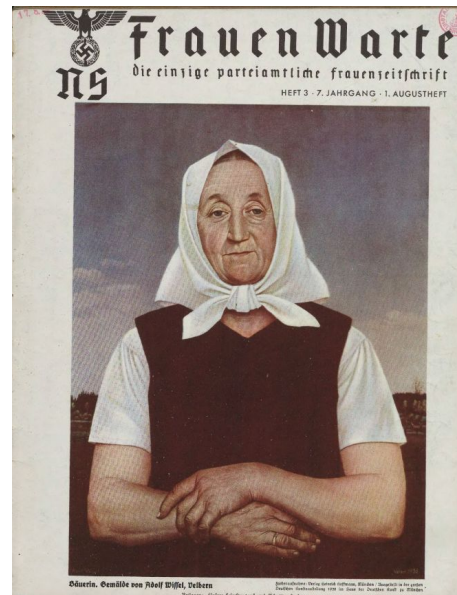
Kobieta z ludu w ujęciu „klasycyzującym”. Obraz Adolfa Wissela Chłopka na okładce narodowosocjalistycznego pisma dla kobiet „NS-Frauen-Warte” (1938), źródło: Elbląska Biblioteka Cyfrowa, domena publiczna

Co więcej, skoro to, co widzimy, działa zawsze jako lustro odbijające naszą własną figurę (a taki jest ogólniejszy sens uwag Lacana: to, co widzimy, jest zawsze powiązane z identyfikacją), to