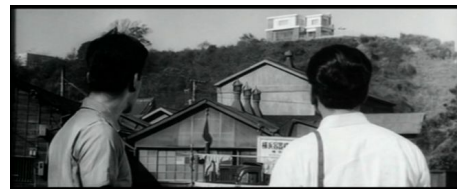
„Jakby patrzył na nas z góry” – Niebo i piekło (1963)

Na relacji wyższości / niższości w kontekście proksemicznym opiera także swój wymiar krytyczny brytyjski film High Rise (2015, reż. Ben Wheatley), dystopia oparta na powieści J.G. Ballarda,