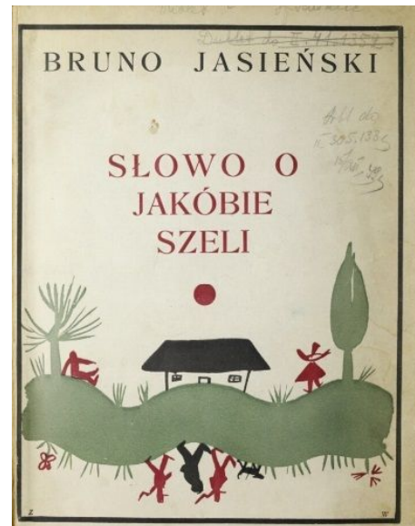
Okładka I wydania Słowa o Jakóbie Szeli (Paryż 1926), projekt Z. Waliszewskiego

Kwestię wykluczenia chłopskiej krzywdy z obszaru prawa Jasiński akcentuje także poprzez odwołania do języka religijnego. Kiedy bunt chłopski trwa, Jakub Szela spotyka na swojej drodze Jezusa 97 , który zstąpił na ziemię po tym, jak usłyszał skargę na krwawe wydarzenia. Zapytanie o los mordowanej szlachty kieruje do przywódcy rabacji, co ma wyraźne konotacje biblijne – jako echo sceny z Księgi Rodzaju , w której Bóg pyta Kaina o jego brata („gdzie jest brat twój, Abel?”, Rdz 4,9). Scena przywołuje więc wymiar rabacji jako „bratobójstwa” 98 , aktu w najwyższej mierze godnego potępienia