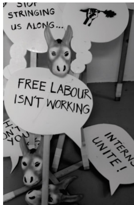
Carrotworkers' Collective, Surviving Internships. A Counter Guide to Free Labor in the Arts , 2017, CC BY 3.0

zajęcia jest niewątpliwym atutem. Po drugie, przy niektórych ćwiczeniach pojawiają się przykłady w postaci linków lub ilustracji. Są to takie zadania jak gra w skojarzenia, wskazanie swojej pozycji społecznej na przygotowanej do tego mapie, kolektywne pisanie listów do instytucji eksploatującej młodych pracowników kultury, uważne czytanie ofert pracy czy tworzenie komiksów, czytanie manifestów i odgrywanie scenek. Zestaw ćwiczeń wydaje się łatwym sposobem zaszczepienia w młodych prekariuszkach świadomości na temat rynku pracy i niepewnego zatrudnienia, które dotyka coraz większej liczby osób. Precarious Workers Brigade kładzie duży nacisk na aktywności zachęcające studentki – przyszłe stażystki i praktykantki – do wzajemnej współpracy oraz do budowania w nich poczucia solidarności, elementu nieodzownego w dalszej praktyce oporu w miejscu pracy. Jest to oczywista krytyka neoliberalnej logiki, w myśl której pracownice traktują znajomości między sobą jedynie jako okazję do stworzenia intratnej sieci kontaktów (s. 16).