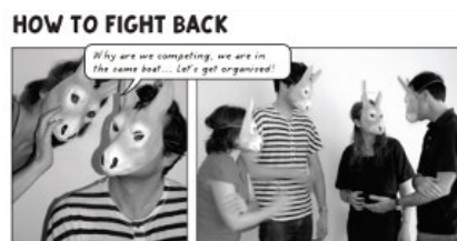
Carrotworkers' Collective, Surviving Internships. A Counter Guide to Free Labor in the Arts , 2017, CC BY 3.0

Ćwiczenia skonstruowane przez Precarious Workers Brigade mają nauczyć młodych prekariuszy tworzenia kolektywnych form oporu wobec dyscyplinujących mechanizmów będących nieodłącznym elementem współczesnego uniwersytetu. Działania proponowane przez autorki pozwalają również na dostrzeżenie alienujących form związanych z pracą studentek oraz wynikającego stąd poczucia osamotnienia oraz braku kontroli nad swoim życiem. Książka nie tylko mierzy się z iluzorycznymi obietnicami praktyk zawodowych – pokazuje za pomocą ćwiczeń i rozmów, czym właściwie są formy pracy w toku edukacji. Jednocześnie jest to podręcznik, pozwalający na właściwe rozpoznanie problemów, z jakimi studentki muszą mierzyć się w trakcie nauki. Training for Exploitation? daje liczne narzędzia do tworzenia kolektywnie zarządzanej sieci kontaktów opartych na pracowniczej solidarności, co może okazać się niezmiernie pomocne w przerwaniu reprodukcji uczniów i studentów jako neoliberalnych podmiotów (s. 8). Należy jednak pamiętać, że skuteczność warsztatów proponowanych w książce polega na ich powtarzaniu – przeprowadzenie ich tylko jeden raz będzie zaledwie ciekawym urozmaicheniem zajęć.