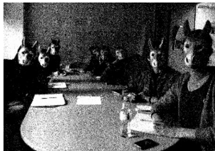
Precarious Workers Brigade and Evening Class, 2017, BY-NC-SA 4.0

Nie ulega wątpliwości, że stawianie oporu prekaryzacji rynku pracy, a w szczególności sektora kreatywnego, jest trudnym zadaniem. Kolektyw jest świadomy, że takie formy oporu jak strajki robotnicze i zakładanie związków zawodowych muszą zostać dostosowane do prekarnych form zatrudnienia (głównie dotyczy to braku fizycznie istniejącego miejsca pracy) 7 . Istotnym ruchem mobilizacji prekariuszy powinno być więc uświadomienie im sytuacji,