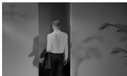
Bownik, Przejście , 140 x 240 cm, 2013, z serii Koleżanki i Koledzy , dzięki uprzejmości artysty.

Pojawiają się jednak próby innego spojrzenia na Sztukę i przedmiotowość , czego ostatnim wyrazem jest znakomity numer „Journal of Visual Culture” (kwiecień 2017) pod redakcją Jeanne Morry i Alison Green, który próbuje podsumować i na nowo otworzyć dyskusję nad tym tekstem. Warto zaznaczyć, że najciekawsze odczytania,